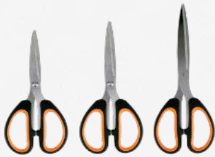
5"(12cm) 6"(16cm) 8"(20cm)