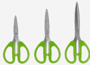
5"(12cm) 6"(16cm) 8"(20cm)